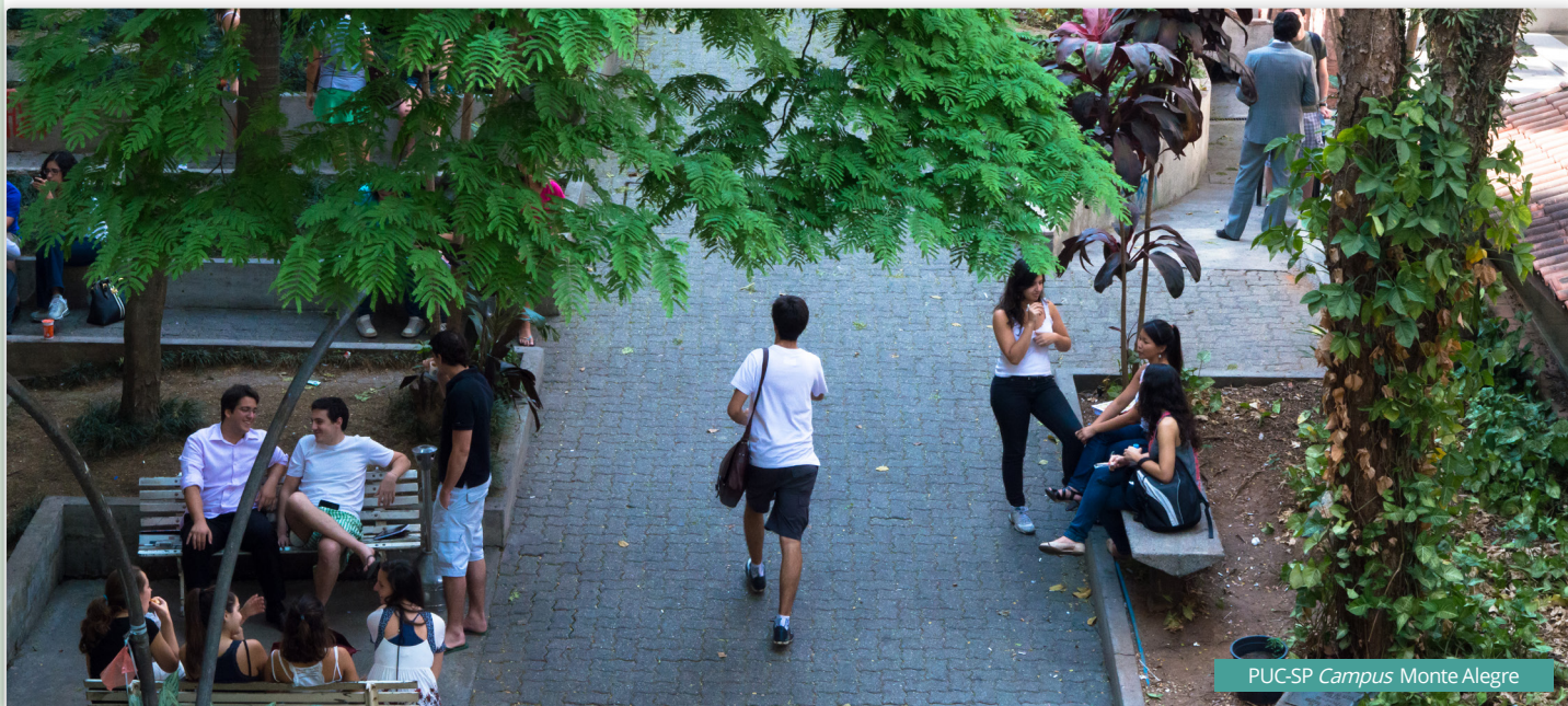
PUC-SP Campus Monte Alegre

4.6 - O candidato que não apresentar o Certificado de Conclusão do Programa, no prazo de 05 (cinco) dias úteis após o final das inscrições, perderá a pontuação adicional. Neste caso, o candidato será reclassificado no exame de Residência Médica PUC-SP, considerando-se a nota final sem a pontuação adicional, correndo o risco de não ocupar a vaga em disputa.