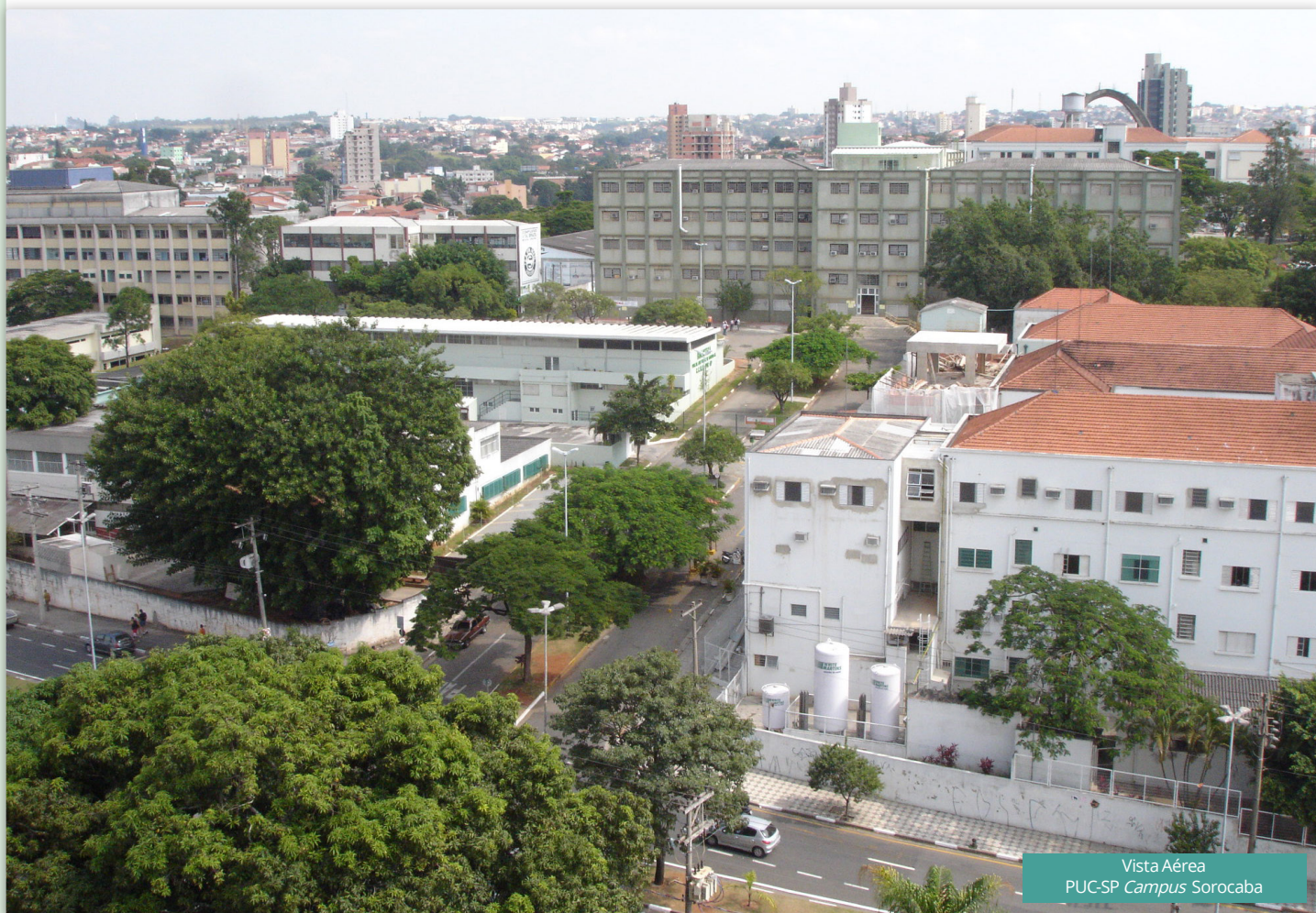
Vista Aérea PUC-SP Campus Sorocaba