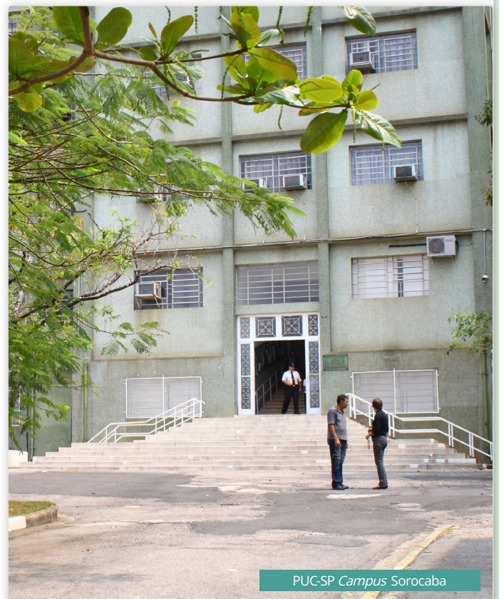
PUC-SP Campus Sorocaba

Os documentos relativos ao Vestibular serão arquivados por 01 (hum) ano após a classificação geral e a divulgação dos resultados.