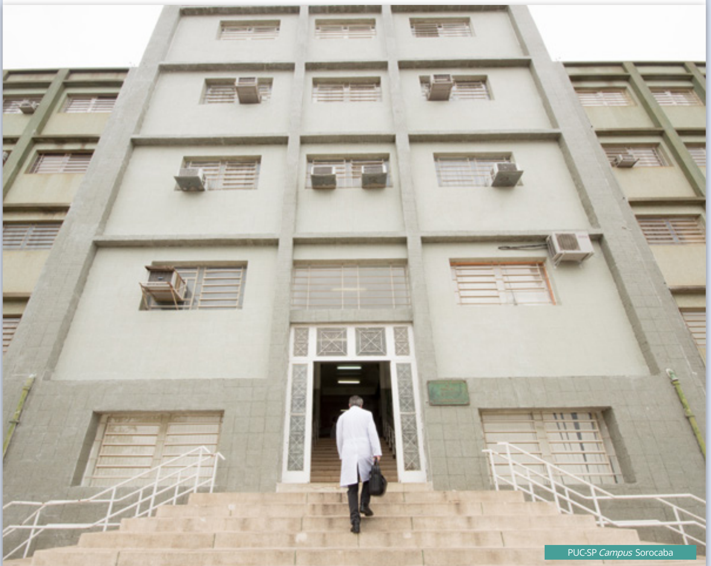
PUC-SP Campus Sorocaba

9.3.11 - Os casos omissos serão resolvidos pela Comissão do Processo Seletivo.