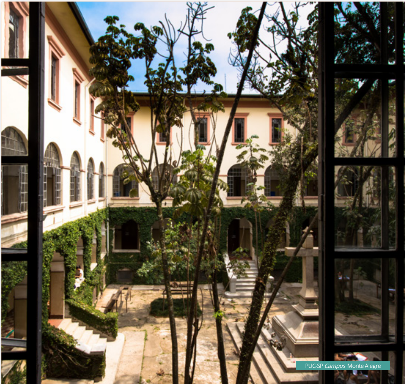
PUC-SP Campus Monte Alegre

11.8 - Não será aceita matrícula fora de prazo, o que implicará na desclassificação do candidato.